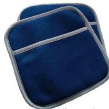
Polarowy ocieplacz na stopy