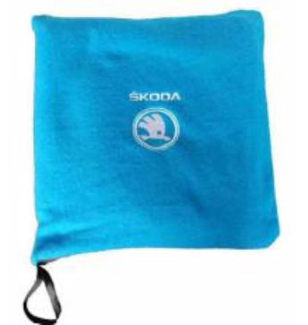
Koc polarowy poduszka